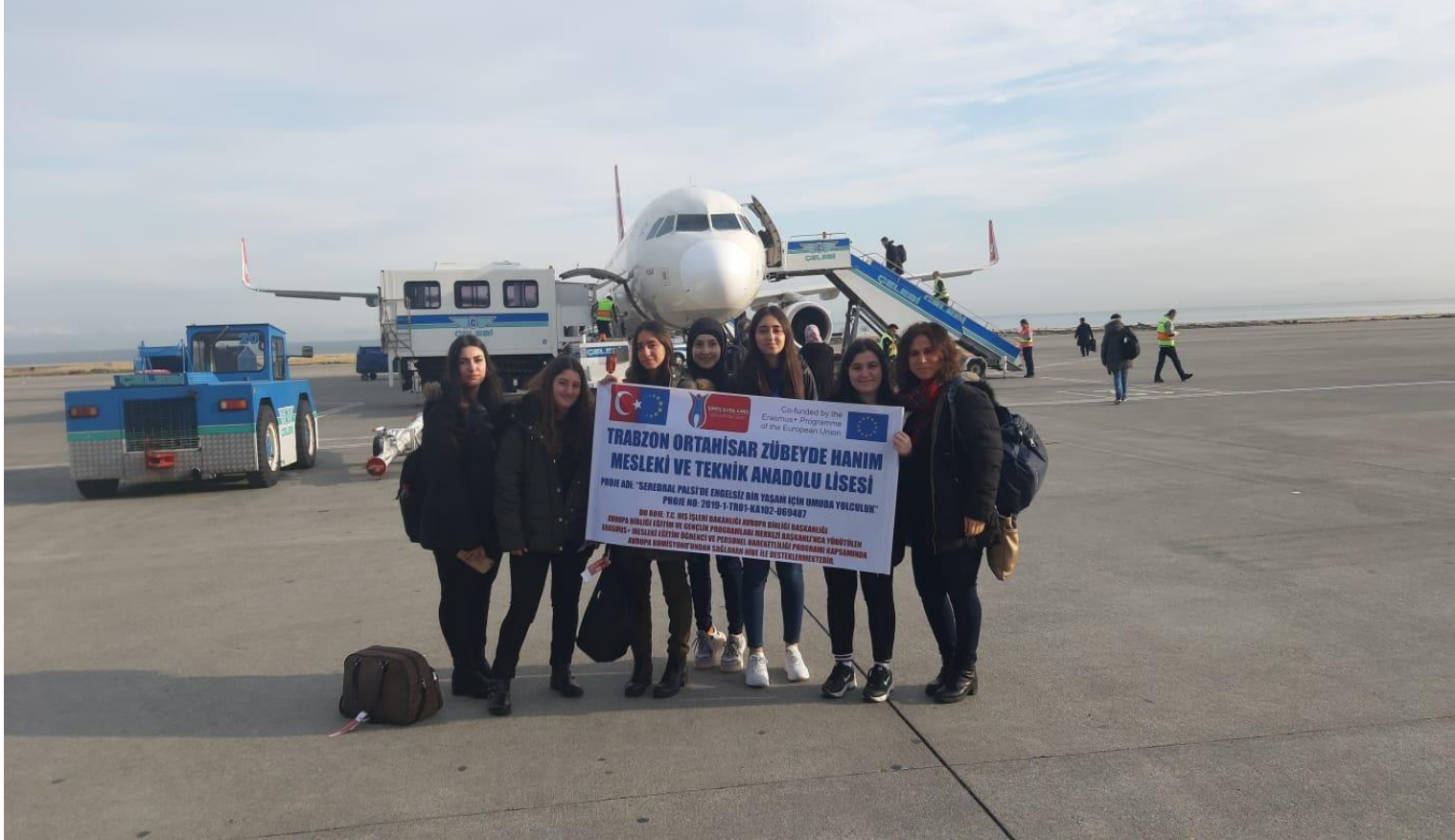
Trabzon havaalanından çıkış.